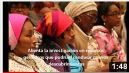
Qué es el protocolo de Nagoya y como se...